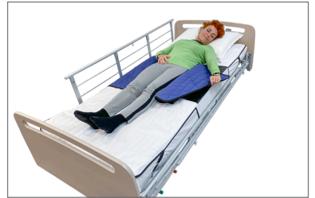
6. Fold Master Turner ud, hvis brugeren har haft den omkring sig.