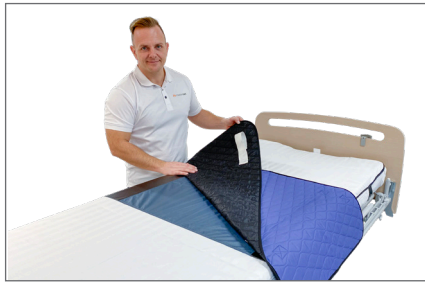
2. Placer Master Turner – S med nylonsiden nedad og den lille side opad.