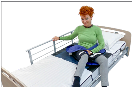
5. Master Turner kan foldes omkring brugerens bækken. Med hånden på sengehesten drejer brugeren sig ind i sengen og løfter selv benene ind i sengen.