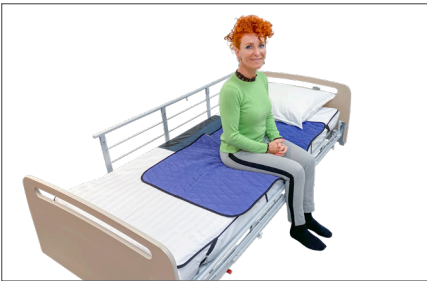
4. Placer Master Turner – S på tværs af sengen, så håndtagene i siderne vender mod hoved- og fodenden. Bruger sætter sig på sengekanten midt på Turner med numsen godt inde i sengen.