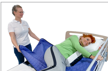
8. Vending med hjælper: Bruger griber fat i sengehesten og påbegynder vendingen. Hjælperen trækker let i Master Turner – S og understøtte vendingen til sideleje. Puder og kiler kan benyttes for en optimal støtte, tryghed og komfort.