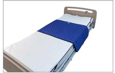
3. Master Turner er nu klar til brug.