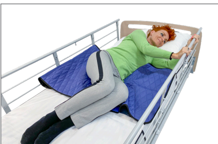
7. Selvstændig vending: Bruger kan gribe i sengehesten og vender sig til sideleje. Glidet under bækket nedsætter friktionen og gør det lettere at vende sig. Lejringskile – S anbefales for optimal støtte, tryghed og komfort.