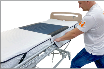
1. Monter Madrascover – S på sengens madras.