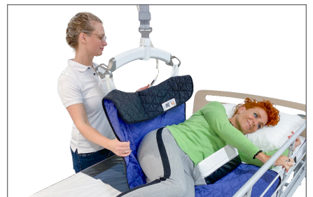
9. Vending med loftlift: Loftliften monteres i grebene. Bruger hjælper til efter formåen. Loftliften eleveres og understøtter vendingen til sideleje. Puder og kiler kan benyttes for en optimal støtte, tryghed og komfort.