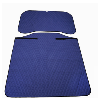
Master Turner Royal Duo