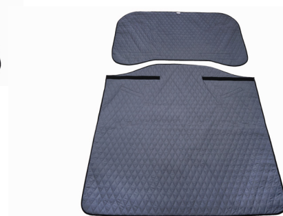
Master Turner Royal Duo Inco