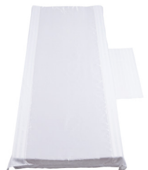
Light Cover - L