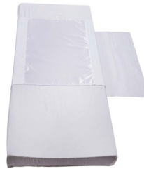
Light Cover - S