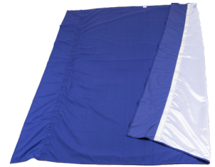
Light Turner Soft - L