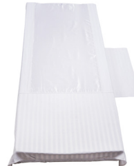
Light Cover - M