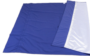
Light Turner Soft - M