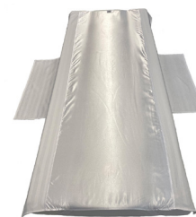
Light Cover - L