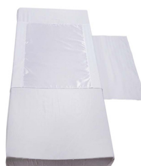
Light Cover - S