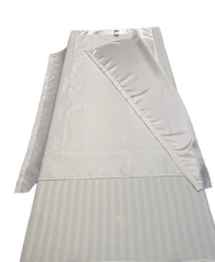
Light Turner - M