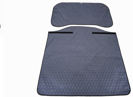
Master Turner Royal Duo Inco