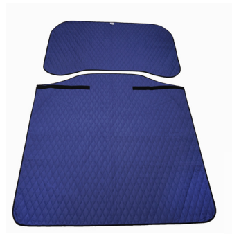
Master Turner Royal Duo