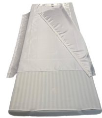
Light Turner - M