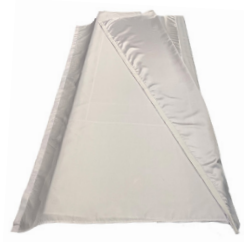
Light Turner - L