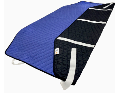
Master Turner Royal