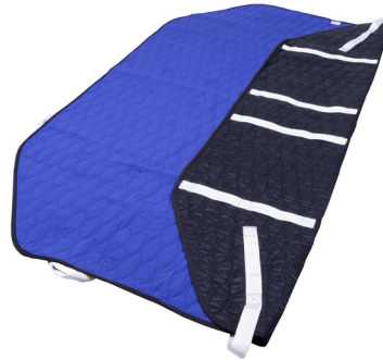
Master Turner Royal Combi