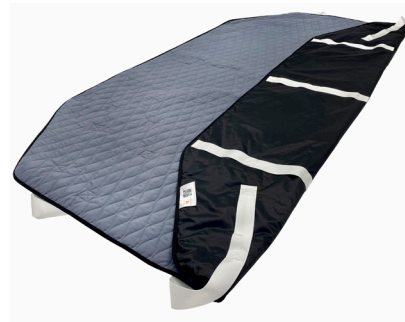
Master Turner Royal Inco